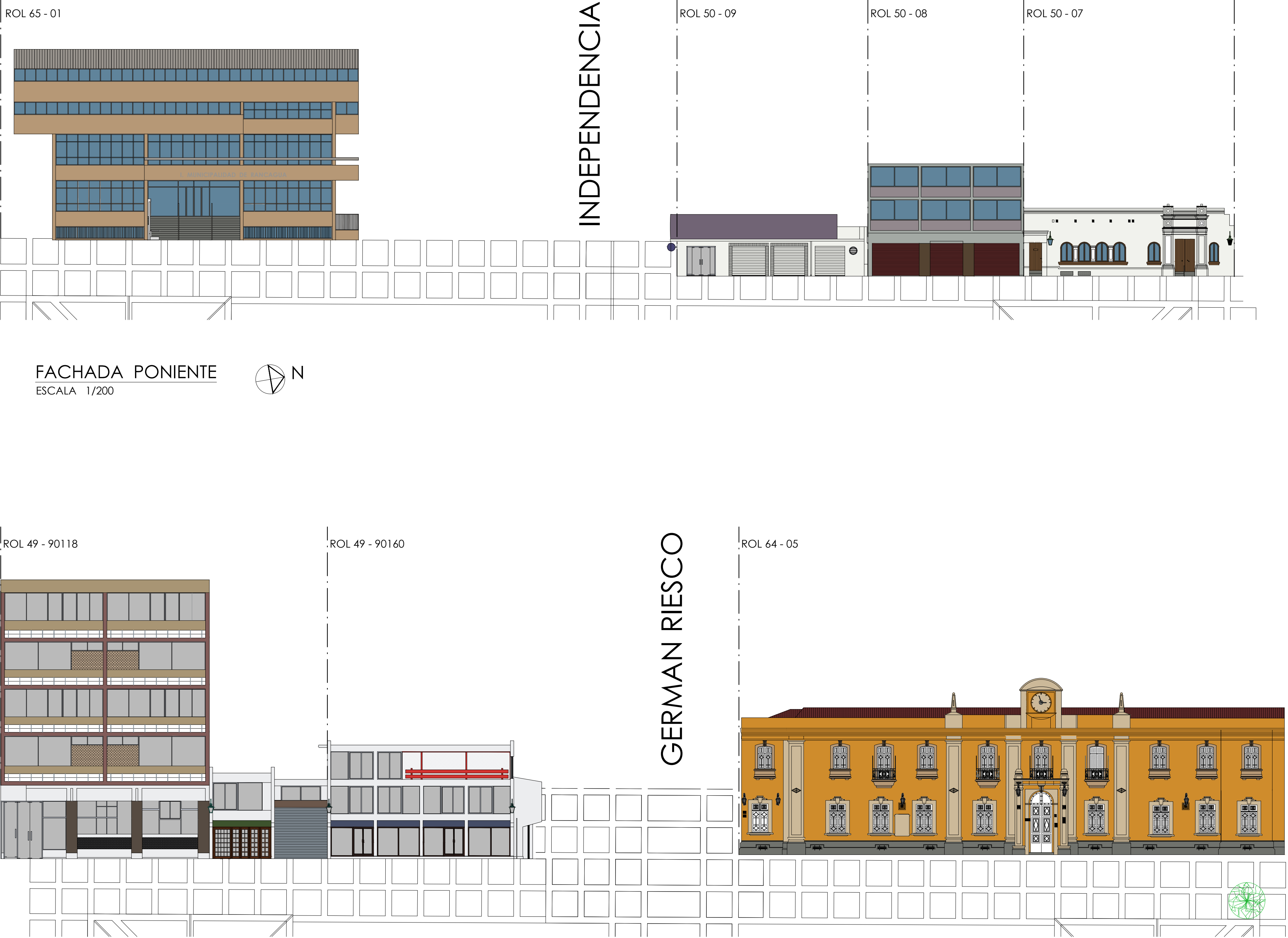
FACHADA PONIENTE ESCALA 1/200