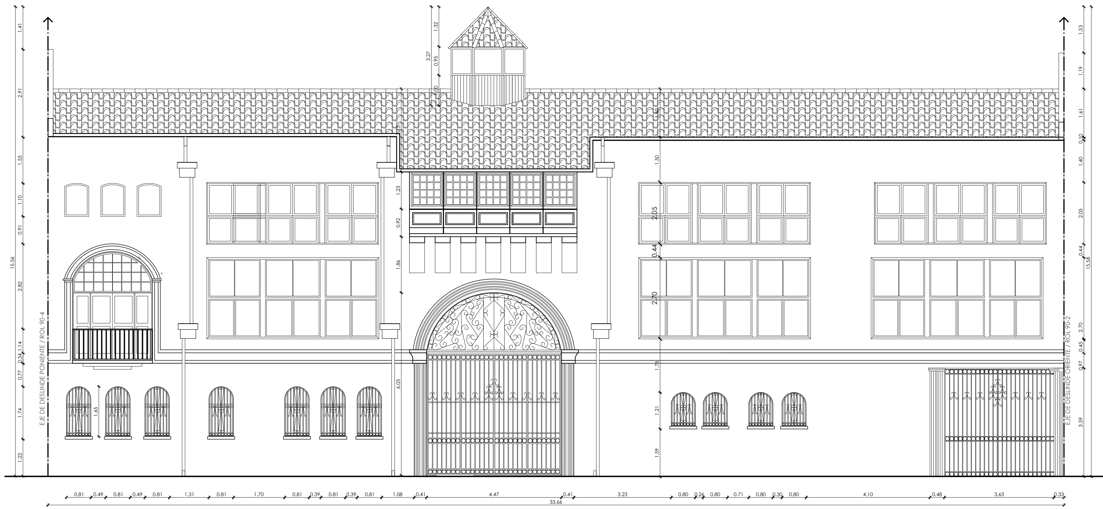
ELEVACIÓN PRINCIPAL ESCALA 1/75