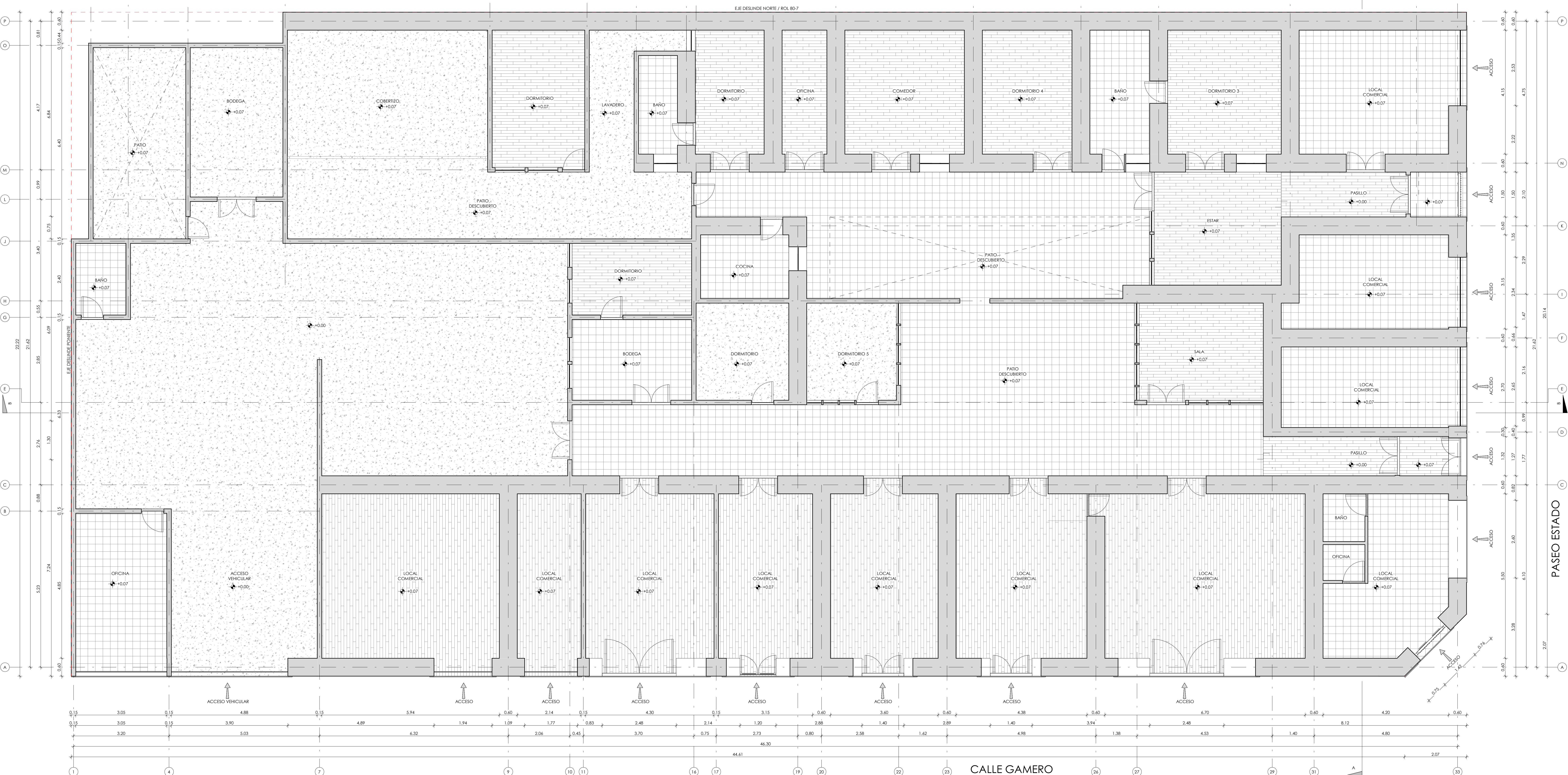
PLANTA ARQUITECTURA ESC: 1/50