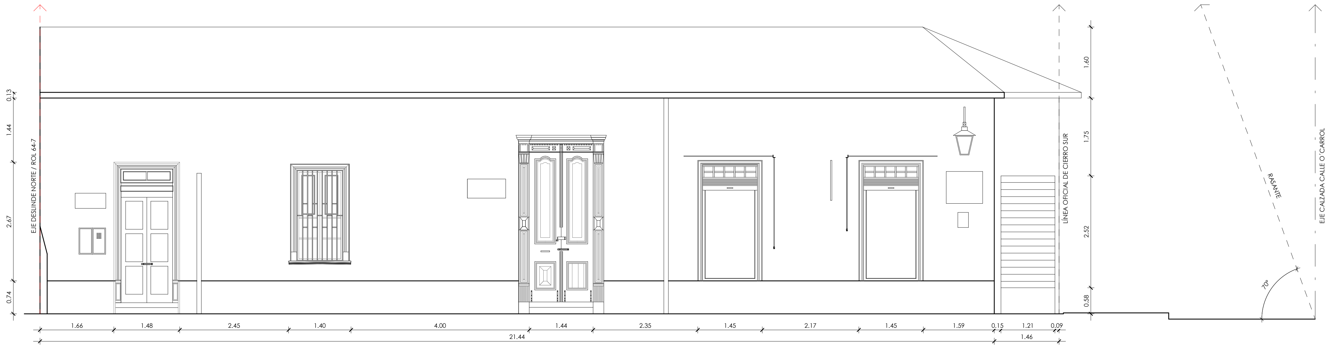
ELEVACIÓN EJE PASEO ESTADO ESC: 1/50